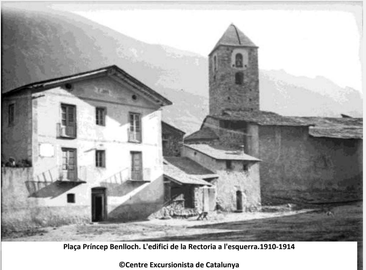
Plaça Príncep Benlloch. L'edifici de la Rectoria a l'esquerra.1910-1914

La Rectoria és l'edifici en el qual el rector de la parròquia viu i és on es gestionen els actes eclesiàstics, com les partides de baptisme, matrimoni o defunció. Era un edifici rellevant en la fisonomia dels espais administratius d'Andorra. En el cas d'Andorra la Vella s'ha d'afegir un element substancial que també denota la rellevància de la capitalitat adquirida des de segles, atès que el rector de la parròquia d'Andorra la Vella és alhora l'Arxipreste de les Valls d'Andorra.