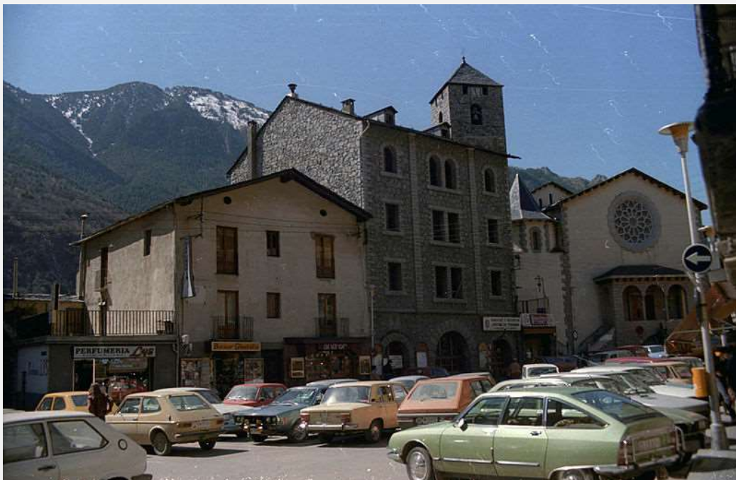
La plaça Príncep Benlloch plena de cotxes. Anys 70 del segle XX. A l'esquerra la Rectoria i a la dreta el Quart.

L'estructura de la plaça es va mantenir de forma més o menys similar fins que l'any 1942 es va inaugurar la nova casa del Quart –edifici de granit- .