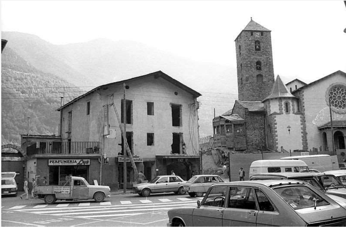
Enderrocament de la Rectoria. Any 1980

A finals del anys 70 del segle XX es va fer un conveni entre el Comú i la Rectoria per tal de modificar i remodelar la plaça Príncep Benlloch: es va enderrocar l'antiga Casa del Quart i la Rectoria i es van integrar en un sol edifici –l'actual-.