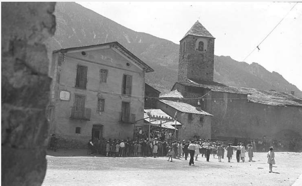
La plaça Príncep Benlloch. 1926-1933. A l'esquerra l'edifici de la Rectoria.

El Principat d'Andorra es configura administrativament en parròquies. Aquesta segmentació té l'origen en la divisió eclesiàstica i va esdevenir la base de l'organització de les Valls. D'aquesta manera, la denominació de parròquia i els límits territorials dels comuns són els mateixos que els eclesiàstics.