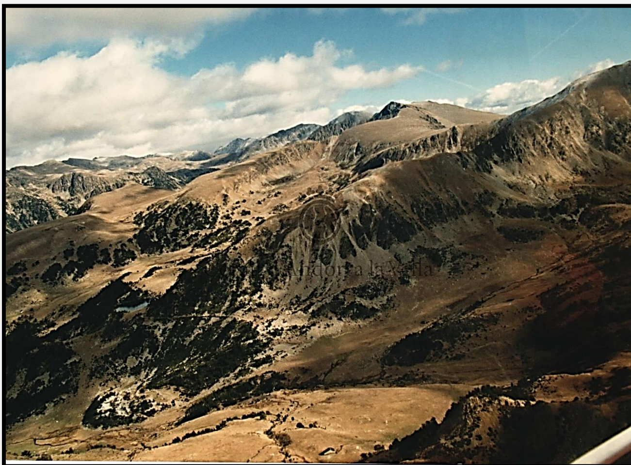
La zona de Claror. Es pot apreciar el refugi i l'estany de la Nou. Any 1987.

Aquesta fórmula d'ús és original per la manca de referents ja que el dret d'accés del bestiar a les pastures era sovint motiu de conflicte i obligava les autoritats comunals a legislar els accessos. 1 Les divisions s'establien en funció de la qualitat de l'herba i del període de l'any per tal d'equilibrar la convivència entre l'activitat agrícola i ramadera basada en el rendiment que una activitat podia comportar sobre l'altra. L'espai natural de pastura del bestiar són les pastures d'alta muntanya i els rebaixants .