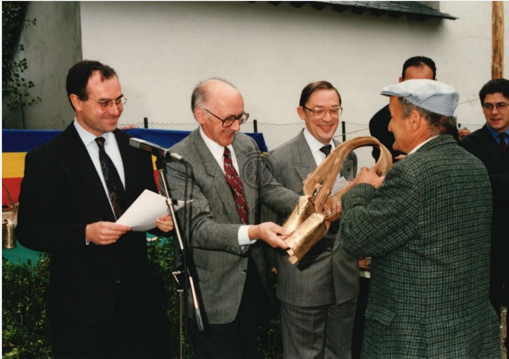
Al costat de Casimir Arajol a l'entrega d'un premi a la Fira del Bestiar d'Andorra_27 d'octubre de 1994.

Persona de gran cultura, ha estat considerat com un home d'Estat, visionari i un humanista. Poc abans de la seva mort va deixar publicades les seves memòries.