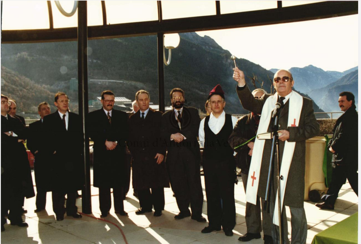
Benedicció de l'escudella de Sant Antoni (A l'esquerra, Òscar Ribas) 17-01-1992

Durant el període en què Òscar Ribas va ser conseller, a finals dels anys 70 del segle XX, ja es parlava de com modificar les institucions per tal d'adaptar el país als estàndards internacionals. No va ser fins l'any 1981 quan es va aprovar el decret de creació del Govern que va representar una evolució respecte el model anterior. Un cop aprovada la reforma institucional, Ribas esdevenia el 8 de gener del 1982 el primer cap de Govern d'Andorra.