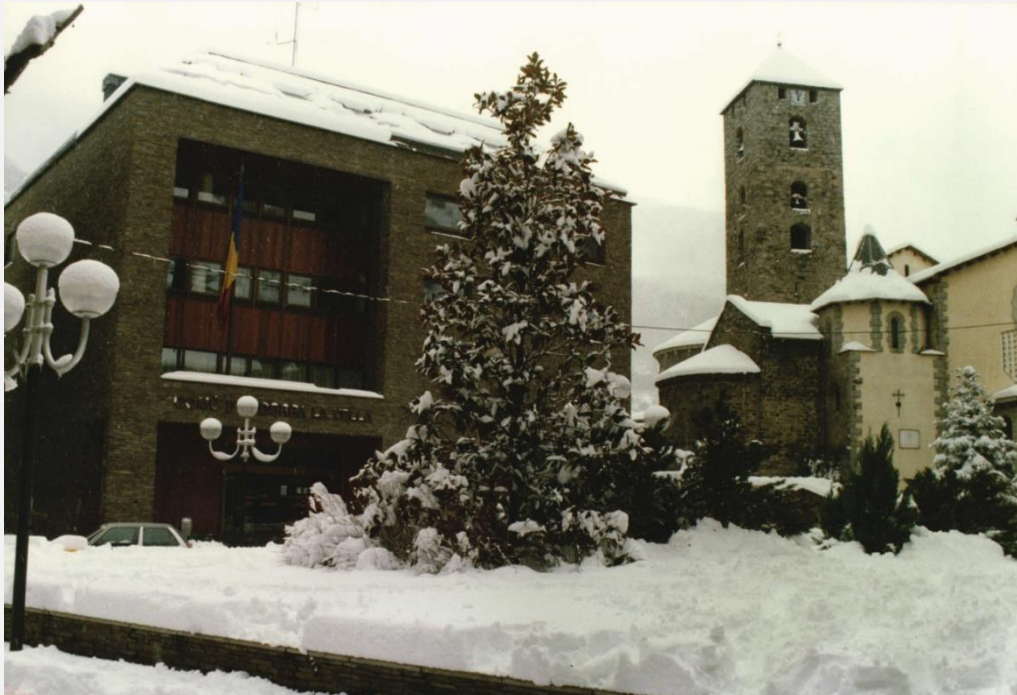
Plaça Príncep Benlloch. 09-12-1990. Les precipitacions van deixar uns gruixos de 40 cm a Andorra la Vella.

La neu va començar a caure la tarda del dissabte 8 de desembre però ningú preveia la situació que es desencadenaria aquella jornada. La constància de la nevada va derivar en una trampa, ja que milers de turistes i residents es van quedar atrapats als seus vehicles quan es disposaven a tornar a les seves llars. La caravana de cotxes no avançava i la situació es complicava perquè les màquines llevaneus no podien passar entre els vehicles per retirar els gruixos de neu acumulats.