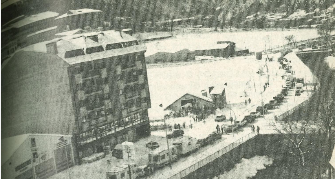
Imatges de l'avinguda Tarragona i del carrer Prat de la Creu el diumenge 9 de desembre de 1990 al matí.

A mesura que passaven les hores ja es veia que caldria activar protocols per donar resposta a les persones que s'estaven quedant atrapades i les diverses administracions i els cossos especials es van haver de coordinar per gestionar la situació. La prioritat va ser, davant la inviabilitat de netejar les carreteres, poder donar allotjament i menjar a les persones afectades.