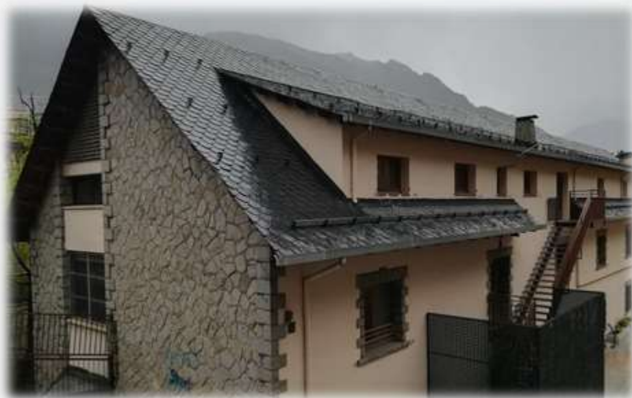
Les escoles del carrer Ciutat de Valls

El desenvolupament del sistema educatiu al Principat es produeix a finals del segle XIX i durant les primeres dècades del segle XX els comuns col·laboraven amb la contractació de professors. A Andorra la Vella s'havien impartit classes a la Casa de la Vall, l'antiga casa del Quart i al carrer de la Llacuna. Així mateix, degut a l'increment d'alumnes es varen construir les escoles de Ciutat de Valls entre els anys 1962 i 1965.