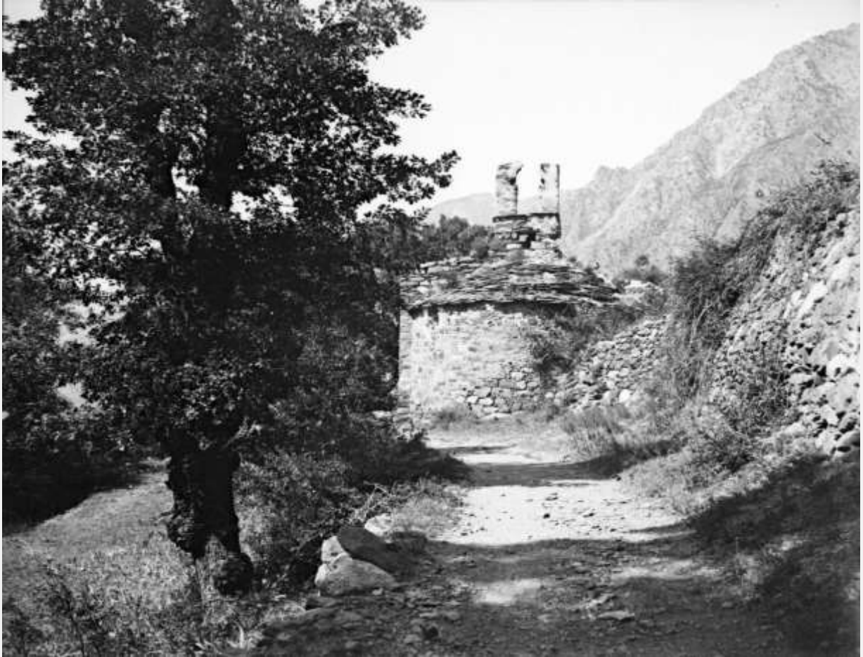
Vista de la capella on es pot apreciar el campanar malmès. Agost 1923

Les capelles, creus i oratoris antigament formaven part dels camins com a element d'orientació i de protecció. La capella de Sant Andreu es trobava al camí ral que venia des del Cap del Carrer d'Andorra i posteriorment travessava la Creu Grossa, que marcava la cruïlla entre el camí d'Escaldes i el que anava a la Massana. 2 Avui dia aquest recorregut transcorreria des l'avinguda Meritxell pujant cap als carrers Bisbe Príncep Iglesias i Creu Grossa, i girant a la dreta pel carrer de Sant Andreu (en direcció a l'Hospital).