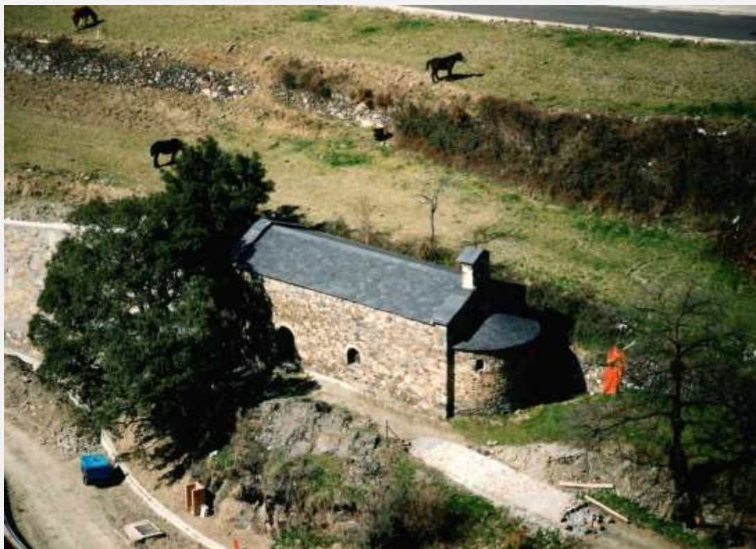
Imatge on es pot veure els treballs de la carretera que enllaça el carrer de Sant Andreu amb l'hospital. També es pot veure les obres del paviment lateral a la capella. Any 1995