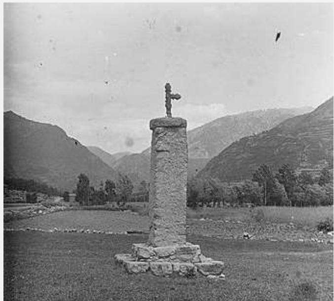
Creu monumental a Santa Coloma_Juny 1916 Fons Josep Salvany_Biblioteca de Catalunya _ANA

Al segle XV les creus més simples es comencen a substituir per creus gòtiques monumentals a les entrades i sortides de les poblacions o en altres indrets dels camins. Pel caminant suposava una salutació de benvinguda, una benedicció i exterioritzava la fe cristiana de la població.