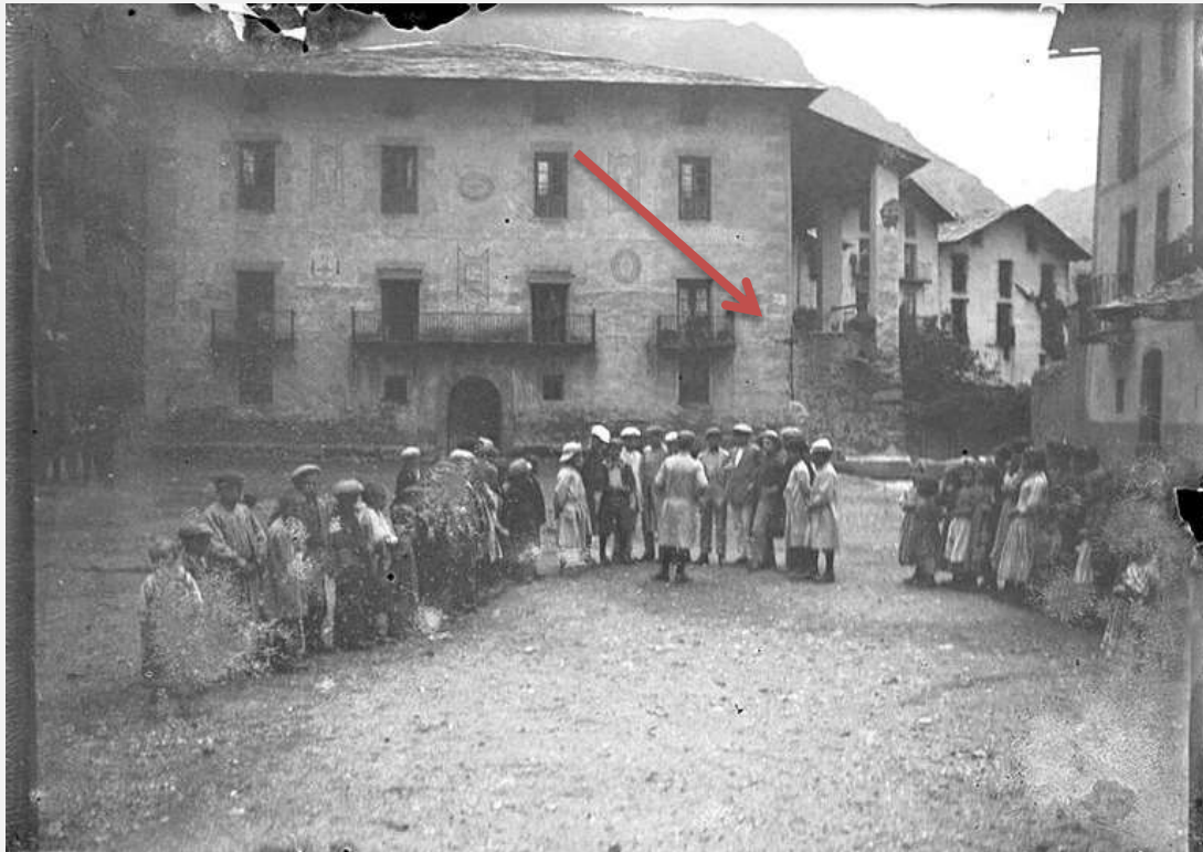
Grup de joves a la plaça d'Andorra la Vella. Any 1902-1907.

Les creus de ferro ja existien en època romànica però les que es conserven com a monumentals són molt més recents. La majoria van acoblades a una base, un fust i un capitell de pedra. Probablement fos degut al fet que aquesta creu metàl·lica està col·locada en substitució d'una creu anterior de pedra. A Andorra la Vella n'hi havia una a la plaça Guillemó i una altra al cap del Carrer.