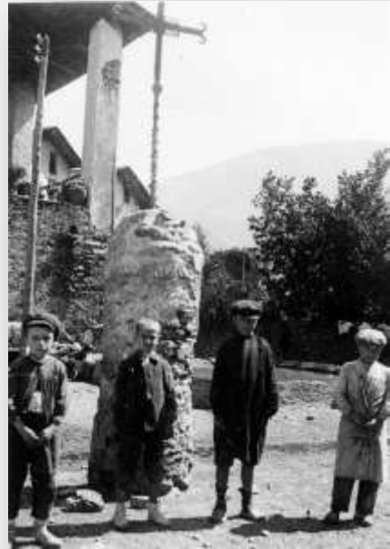
Placeta del Cap del Carrer. Any 1921 i retrat de quatre nens al costat de la creu de la plaça d'Andorra la Vella. Any 1900-1913

L'any 2011 es va instal·lar un cruceiro, creu monumental típica de Galícia, que està col·locada prop l'Stela, a la cruïlla de l'avinguda de Santa Coloma i la baixada del Molí. Va ser projectada per l'Associació Cultural Casa de Galícia al poble andorrà en reconeixement de la seva amistat i agermanament amb el poble gallec.