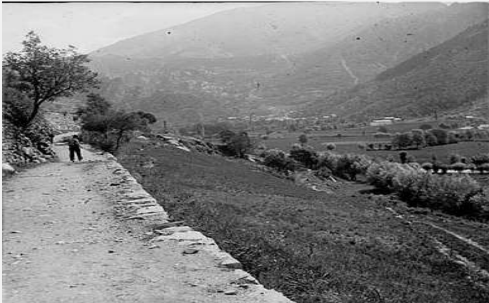
Antic camí ral on es trobava la Creu Grossa. Vista de la vall central_1890-1900

Abans de la creació de carreteres i que es desplegués la xarxa viària, els camins d'Andorra estaven adaptats a la circulació d'animals i al pas de cavalcadures. Els camins més importants tenien la denominació de camins rals i en els seu recorregut hi havia la presència de creus, oratoris i petites capelles que tenien com a objectiu la protecció espiritual de caminants i viatgers. 1