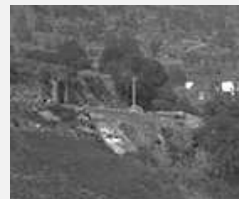
Ampliació de la imatge

La capella es trobava enfront de la Creu Grossa. Tenia una arcada amb volta de canó i desconeixem si contenia algun tipus d'altar o sant. L'única documentació escrita de què disposem és la de l'historiador Pere Canturri, i relaciona la capella amb la font de la Call -descriu que la canonada d'aquesta font, que es troba prop del Sant Ermengol, arribava a la capelleta i per aquesta raó s'anomenava font de Sant Bernabé -. A més, relata que quan la gent baixava a alguna festa a Andorra solia rentar-se els peus en aquesta font i es canviaven les espadenyes. 3