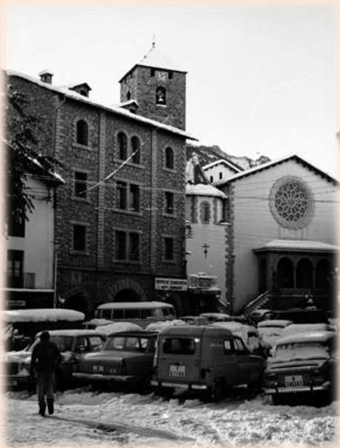
Vista del campanar amb l'esfera del rellotge (1968-1975). També es pot apreciar l'antiga casa del Quart d'Andorra.

L'esfera es va instal·lar durant el mes de novembre de 1968, i el seu pagament queda acreditat uns dies després, en concret, el 3 de desembre a l'empresa Casa Cronos de Tarragona per un import de 16.993,50 pessetes.