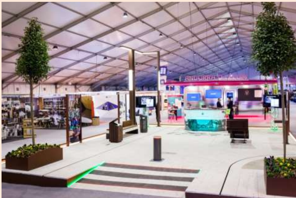
Muntatge de la 39a Fira.

Des de la dècada dels anys 90 s'accentua la sectorització que requereix una major logística en la distribució dels espais, així com la coberta amb envelat, per tal de prevenir les inclemències meteorològiques.