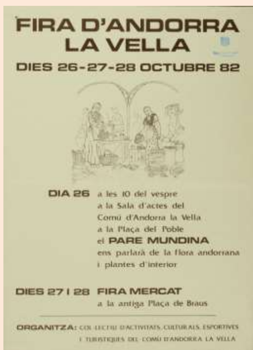
Programa de la Fira de l'any 1982.

Amb el pas dels anys la Fira s'especialitza i es desvincula del lloc físic de la Fira del Bestiar i s'adapta el calendari amb la referència del dia 27 d'octubre.