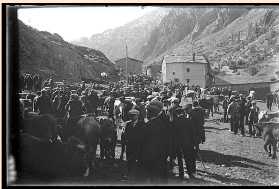
Fira d'Andorra la Vella a les Peces del Felip Blau, al darrere de la Casa de la Vall, on actualment hi ha l'aparcament de Sindicatura. 30/10/1930

Els orígens s'emmarquen en les fires medievals que es feien a la tardor per vendre o intercanviar els productes del camp i el bestiar. Alguns textos situen l'origen de la Fira en el context dels privilegis que atorgaren els consenyors als andorrans. En destaca el de Gastó IV de Foix i el bisbe Roger de Pallars, el 1448, per a celebrar una fira anual a Andorra la Vella. Tot i així, la fira del bestiar contemporània es va fixar l'any 1884 per als dies 31 d'octubre i l'1 de novembre 1 .