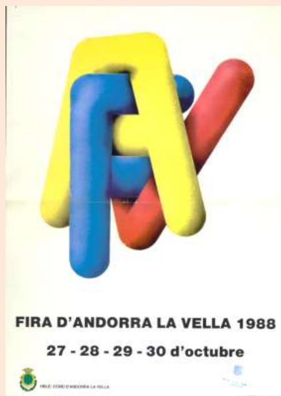
Cartell de la Fira de l'any 1988