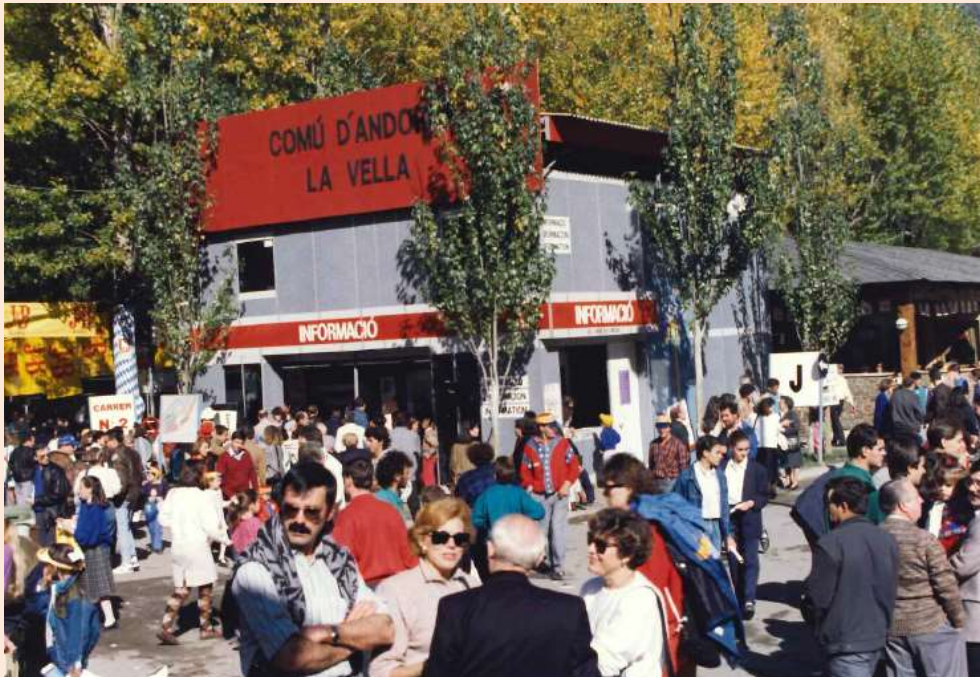
Estand del Comú a l'aire lliure. Any 1988

La consolidació es tradueix en un augment exponencial dels expositors, així com en afluència de visitants. Un dels aspectes que van causar més expectació, va ser l'emissió Telefira l'any 1986 quan el Principat encara no disposava de canals de televisió propis.