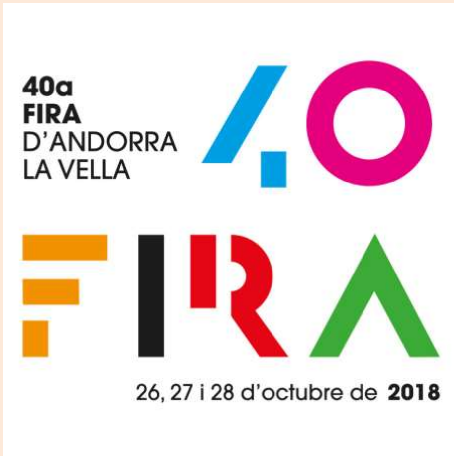
Cartell de la 40a Fira d'Andorra la Vella

La Fira d'Andorra la Vella és un esdeveniment viu i en constant evolució. És una data assenyalada on milers de ciutadans es retroben i s'interrelacionen. Els estaments públics o associacions contacten directament amb el ciutadà. En clau comercial representa l'oportunitat per a les empreses del país i foranes per donar-se a conèixer.