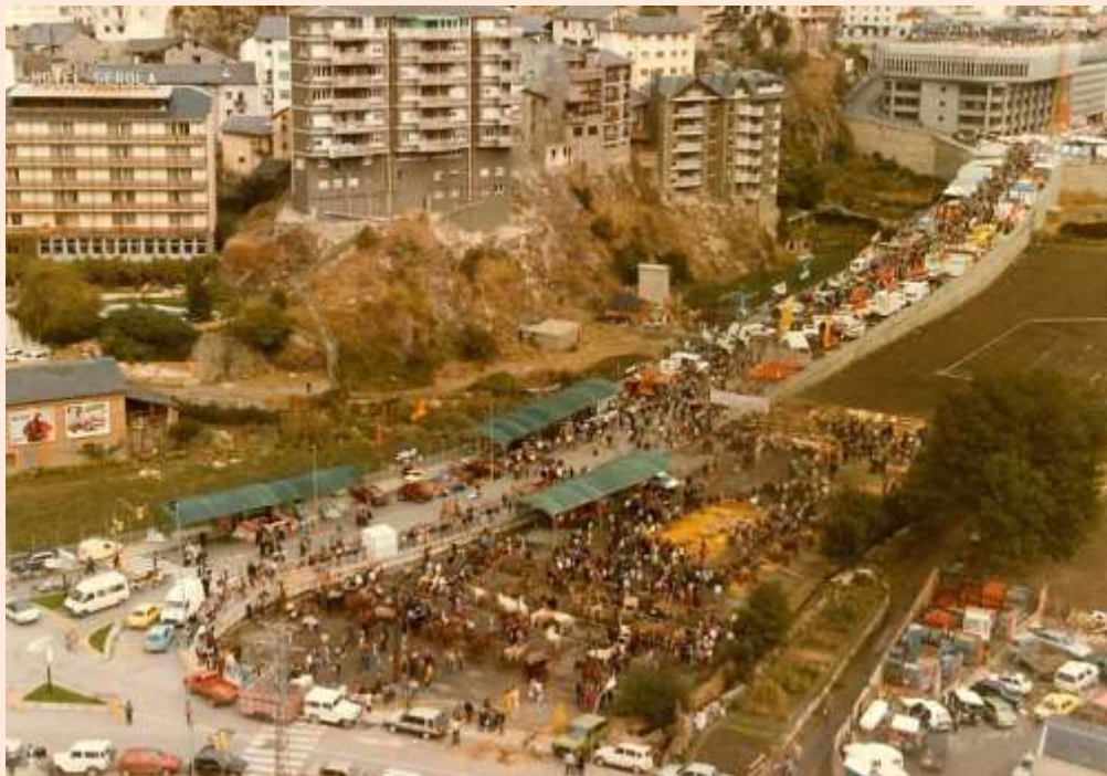
Les parades al llarg del carrer Prat de la Creu (1985).

En un inici les parades s'instal·len prop de la Fira del Bestiar, al voltant de la plaça de braus, allargant-se pel carrer Prat de la Creu.