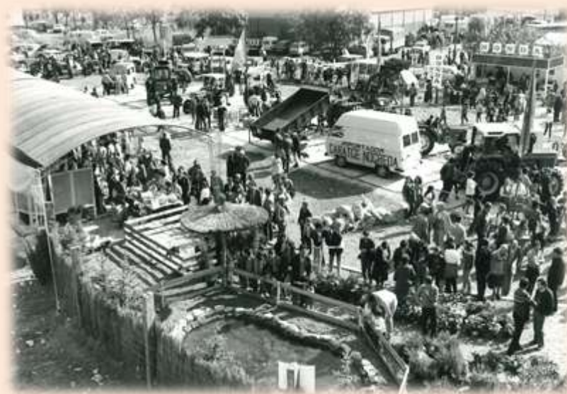
Els expositors instal·lats en paral·lel a la Fira del Bestiar. Any 1982

S'enceta l'any 1982 mitjançant el Col·lectiu d'Activitats del Comú d'Andorra la Vella, amb l'animació i lluïment de la Fira del bestiar amb expositors locals i forans, una exposició de maquinària agrícola i una conferència. Els mitjans de comunicació de l'època es referien a la Fira Concurs per la vessant ramadera i parlaven de Mercat en referència a l'activitat més comercial organitzada pel Comú.