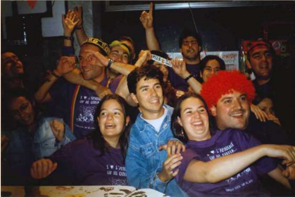
Imatge d'alguns integrants de la Colla del Cap del Carrer

La primera edició va ser al juliol de 1985 quan una colla d'amics sota el nom de La Colla del Cap del Carrer va incentivar una festa genuïna, que es duia a terme el darrer cap de setmana de juny o el primer de juliol.