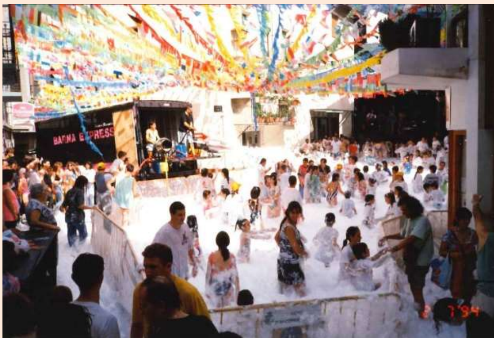
Festa de l'Escuma. Any 1994

Les activitats estaven adreçades a un públic divers sense deixar de banda cap segment de la població. La festa de nit va ser el plat fort de la gresca i van ser sonats els concerts dels personatges que van fer furor als anys 90 com Cañita Brava i Josmar .