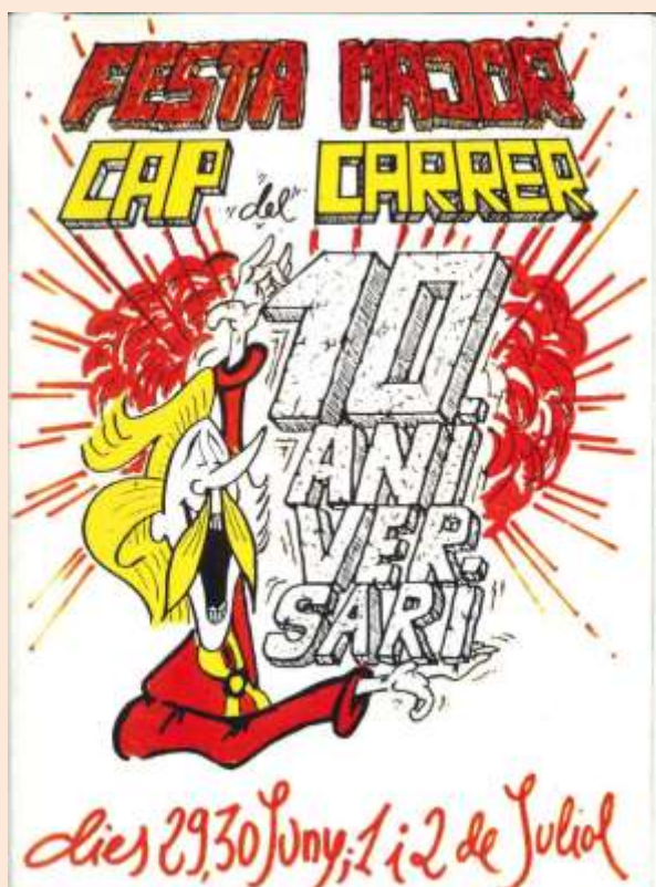
Portada del programa en el 10è aniversari de la Festa Major del Cap del Carrer l'any 1995

En aquest ambient estival va sorgir l'any 1985 una de les festes de més èxit de la parròquia: La Festa Major del Cap del Carrer .