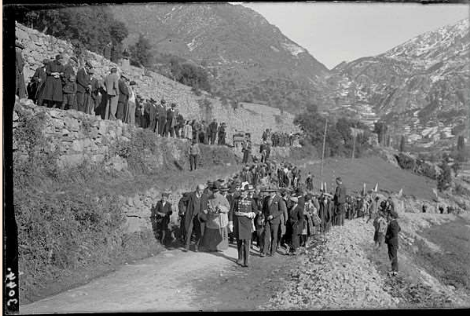
Actes oficials de la inauguració de l'eixamplament i de l'ampliació de la primera secció de la carretera entre Andorra i Encamp. ANA_Fons Guillem de Plandolit_28/10/1929

Les comunicacions van canviar amb la construcció de les carreteres. Un moment clau va ser la inauguració de la carretera entre la Seu d'Urgell a Andorra la Vella l'any 1913 i que va ser impulsada pel bisbe Benlloch 2 . Aquesta fita va derivar en una posterior ampliació de la xarxa viària sobretot a partir dels anys 30 en relació amb la construcció de F.H.A.S.A.