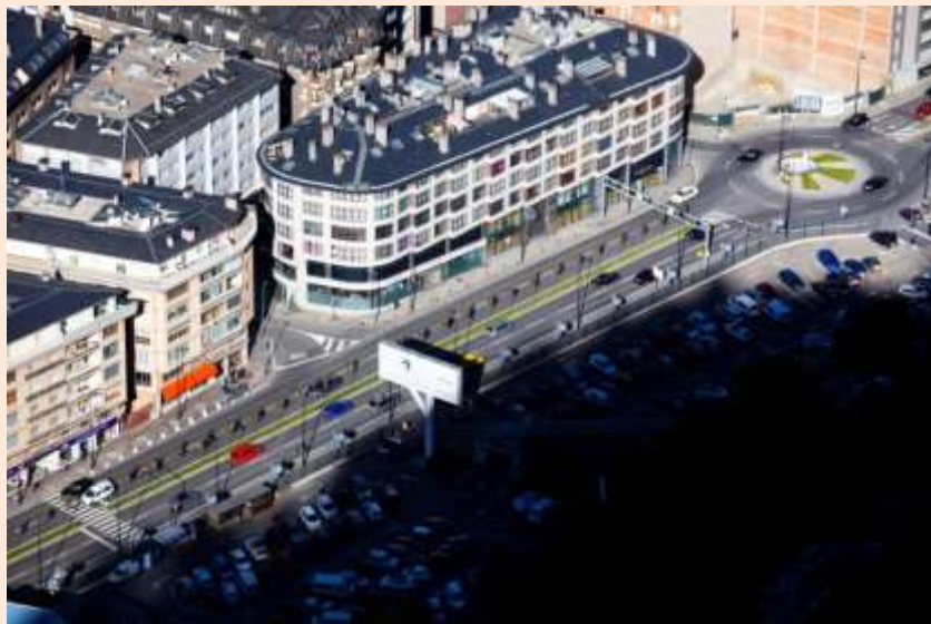
Vista parcial de l'avinguda de Tarragona

L'ex-cònsol d'Andorra Benet Pantebre (1974-1975) explica a les seves memòries 5 com va desencallar-se la situació, que estava afectada per problemes entre veïns de la zona, el Quart i el Consell General. Conscient que el camí vell formava part de l'antic camí ral una de les dificultats va ser segons ell que: "alguns consellers de la Comissió d'Obres de la Casa de la Vall dubtava si aquesta via es considerava carretera general o secundària".