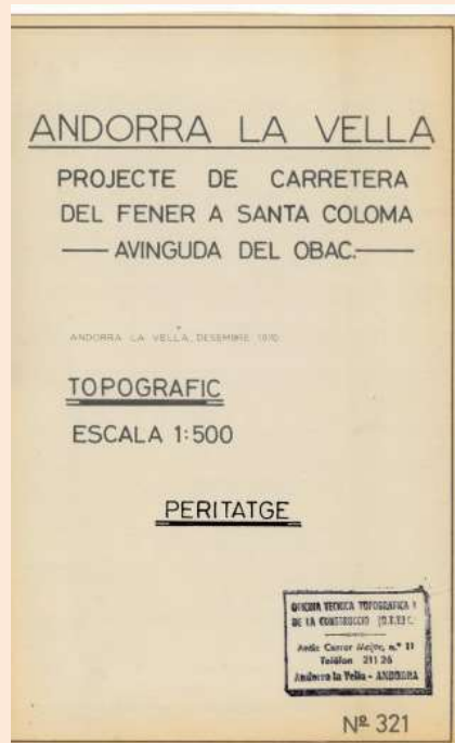
Plànol del peritatge encomanat pel Quart d'Andorra

A partir d'aquest moment s'engegarien les negociacions amb propietaris, així com amb el Consell General per tal de dur a terme el projecte. Les gestions seran motiu de friccions i desavinences des de diferents perspectives: obres sense consentiment, interpretacions, indemnitzacions. El mateix peritatge va causar discòrdia i al llibre d'actes del Quart en serà constant la menció al tema. També es creen comissions específiques i es varen convocar reunions de poble.