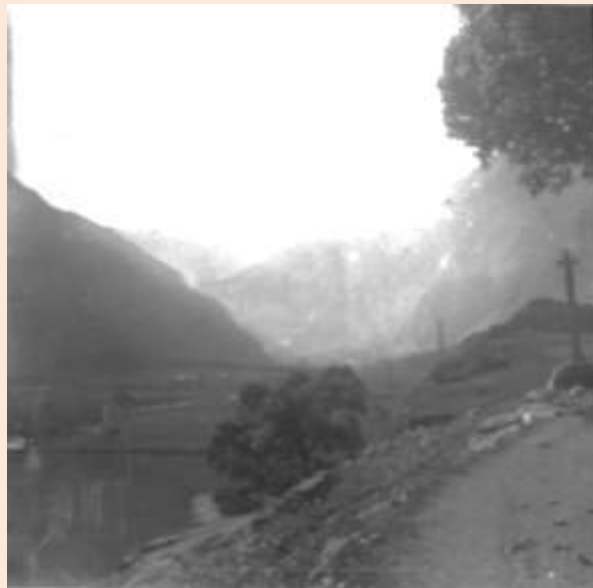
Antic camí ral d'Andorra la Vella. Creu Grossa i vall central d'Andorra la Vella. Vista nord-sud.

Les vies de comunicació a Andorra han estat tradicionalment molt rudimentàries. Els camins principals, destinats al pas de bestiar i persones, eren anomenats com a camins rals. Avui dia es conserven alguns trams, d'altres estan totalment perduts, i en ocasions resten com a nomenclatura de nom de carrer.