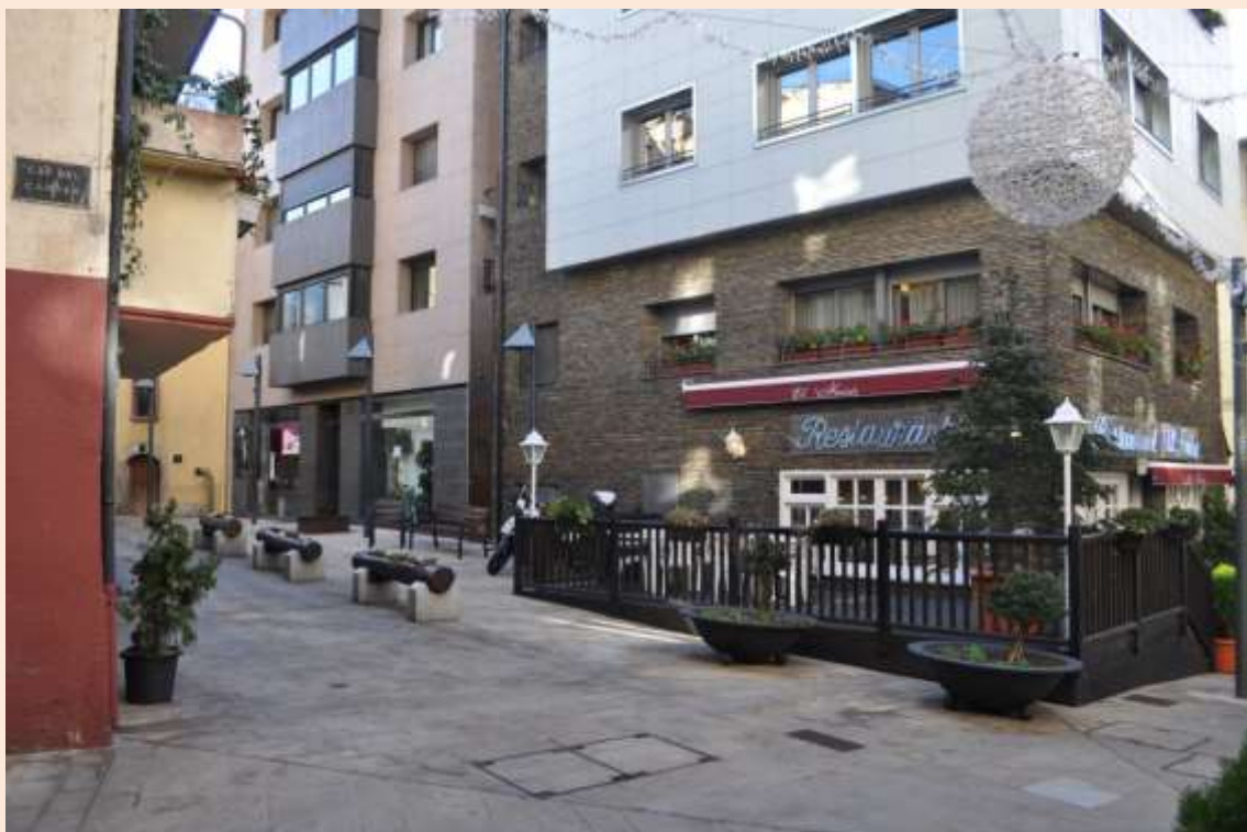
La ubicació on es trobava el Mercat (actualment restaurant El Faisà).