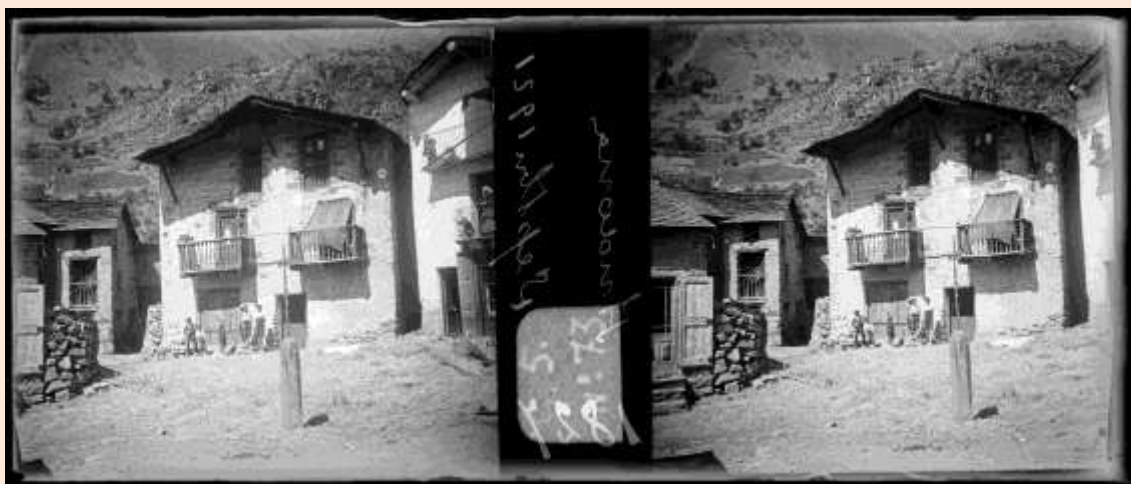
Placeta del Cap del carrer. Any 1921_ANA_Centre Excursionista de Catalunya

El Cap del Carrer d'Andorra la Vella és un espai rellevant per a la història andorrana, ja que en la Baixa Edat Mitjana havia estat l'emplaçament de l'antiga seu del Consell de la Terra 1 , anterior a la compra de Casa de la Vall, com a seu del Consell General.