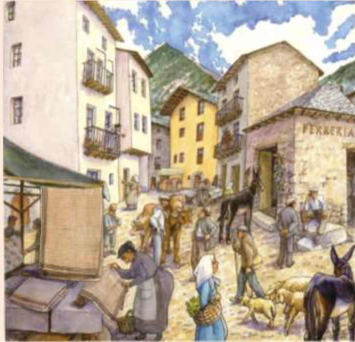
A la imatge, el cartell de la Fira Concurs de 2009, obra de Sergi Mas. L'edifici de la ferreria (a la dreta) seria l'edifici del Mercat.

1. Pujal, A. i Lladós, J.: La Domus del Consell de la Terra . Andorra la Vella.2008