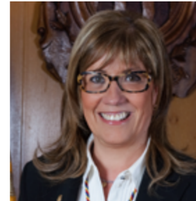
Mònica Codina Consellera menor Consellera de Promoció Turística i Comercial