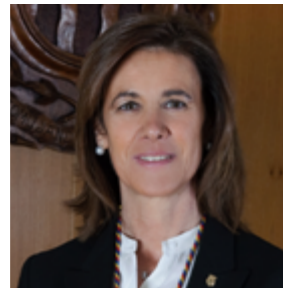
Ester Vilarrubla Consellera de Social