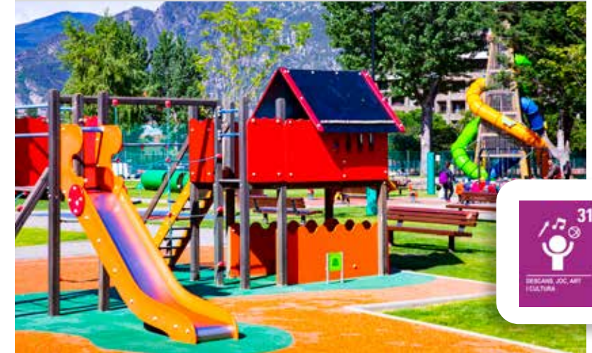
Entre els projectes destacats, la renovació d'una bona part dels jocs del Parc Central i l'ampliació del servei de bus comunal.

El pressupost aprovat pel Consell de Comú reflecteix la consolidació del projecte iniciat el 2016 de transformació d'Andorra la Vella en una parròquia per a les persones amb la creació de nous equipaments i valorització d'espais. El carrer Doctor Vilanova, una de les portes d'entrada principals a la capital que connecta l'avinguda Tarragona amb el carrer Prat de la Creu, millorarà i s'ampliarà a tres carrils per guanyar en comoditat i fluïdesa en el trànsit. L'actuació permetrà centralitzar de nou l'entrada al nucli històric i comercial de la capital del país. La previsió és haver d'afrontar també l'arranjament necessari per motius de seguretat del viaducte que connecta la rotonda del Govern amb la plaça Rebés. En aquesta mateixa zona es preveu l'inici del procés de remodelació de la Plaça del Poble i entorns. Després de l'estrena progressiva de noves zones