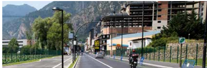
L'edifici de Santa Coloma es construirà al carrer del Cedre, darrere d'aquests edificis de l'avinguda d'Enclar amb els quals compartirà l'accés al pàrquing gràcies a un acord assolit amb la propietat.