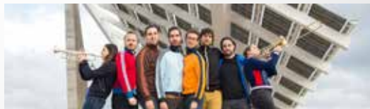
GERTRUDIS 23 H - PLAÇA GUILLEMÓ