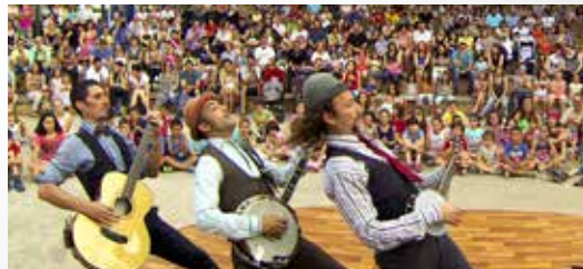
CIA. INFONCUNDIBLES 22.30 H - PLAÇA DEL POBLE