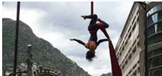
CIA. RIGUEL 18 H - PLAÇA DE LA ROTONDA