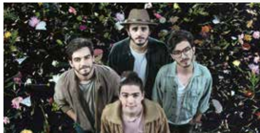
MORAT 21 H - APARCAMENT PARC CENTRAL

23.30 h: Balkan Paradise Orchestra, xaranga musical. I a partir de les 00.30h, fi de festa amb Hotel Cochambre (Versions). [Plaça Guillelmó]