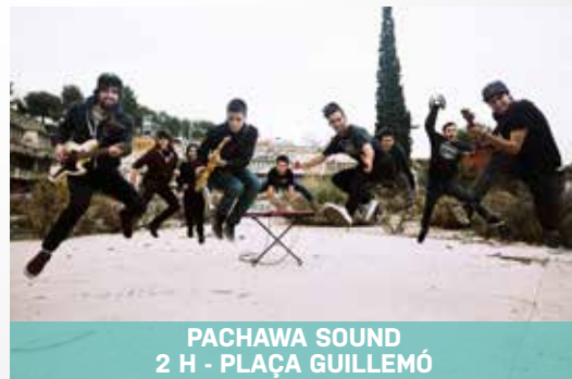
PACHAWA SOUND 2 H - PLAÇA GUILLEMÓ