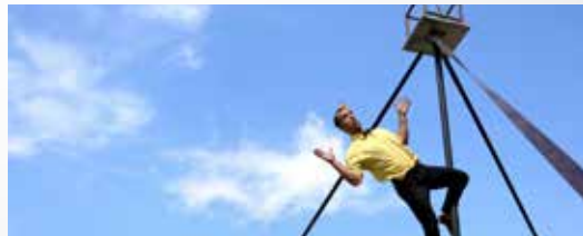
CIA. VERMUT 22 H - PLAÇA DEL POBLE