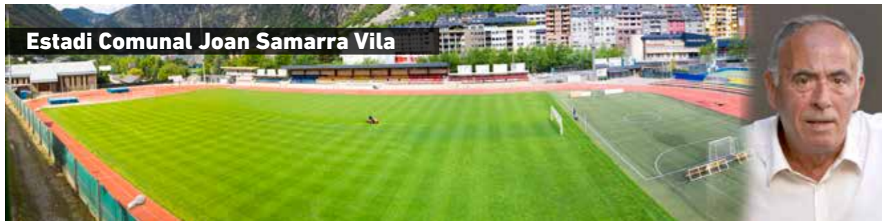
Estadi Comunal Joan Samarra Vila