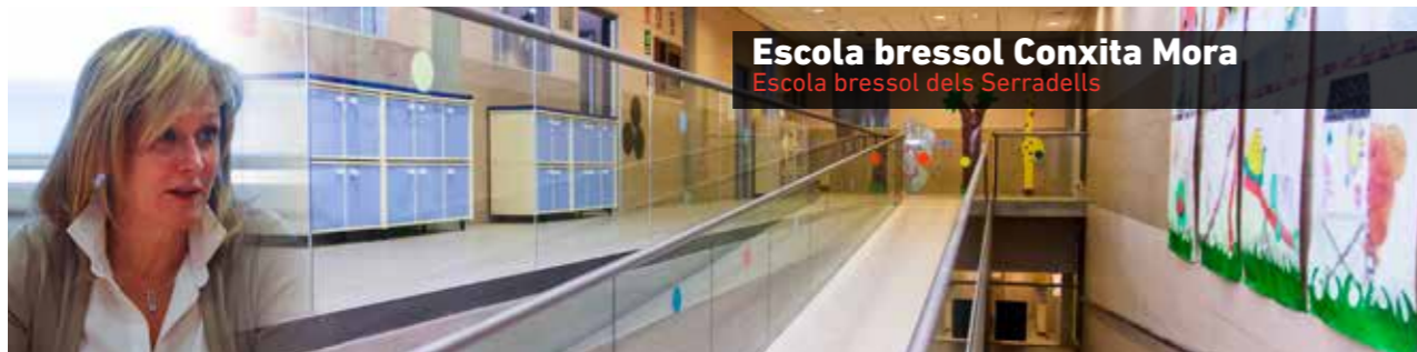
Escola bressol Conxita Mora Escola bressol dels Serradells